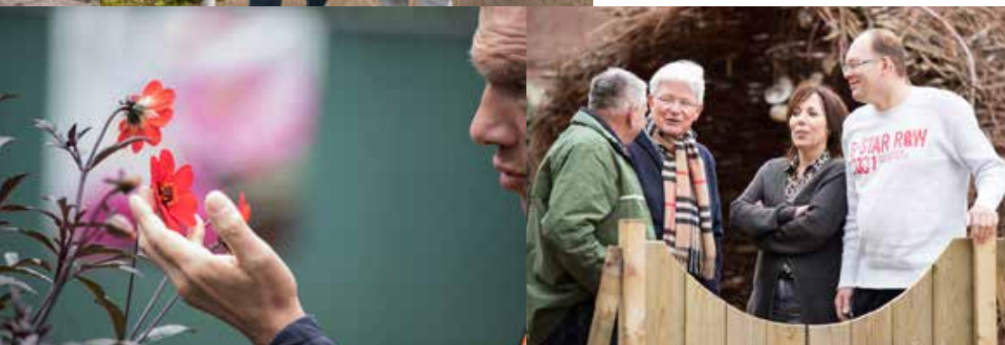
Van mens tot mens

manier naar je werk te kijken. In proeftuinen onderzoeken we wensen en mogelijkheden. Samen brengen we nieuwe zorgconcepten van de proeftuinen naar de 'werkvloer'."