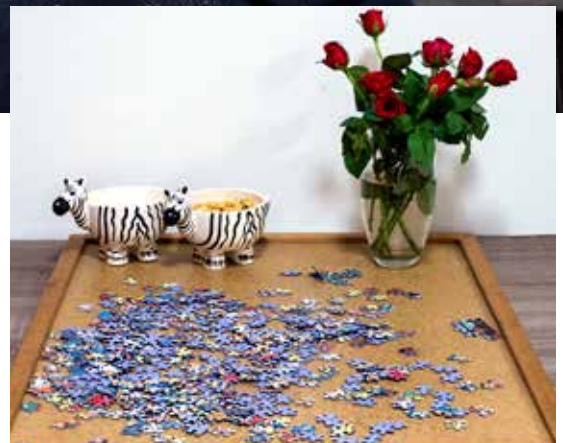
“Die twee zebra’s, die vind ik zo leuk. Ik heb ze gewonnen met kienen.”