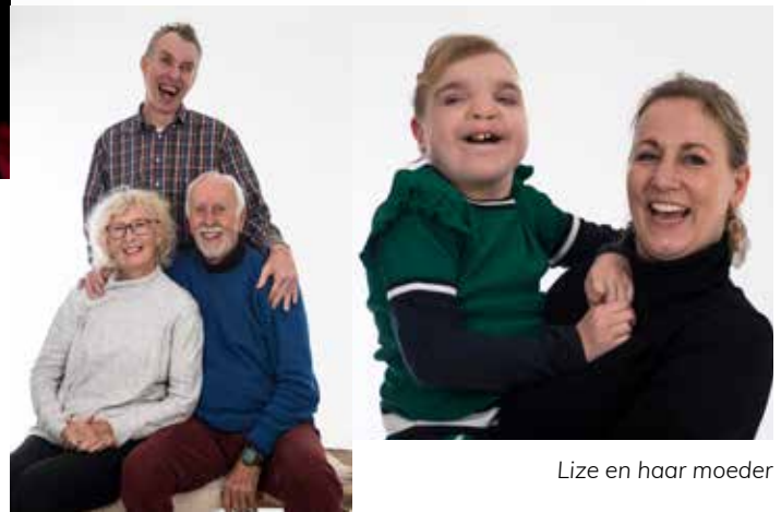
Lize en haar moeder